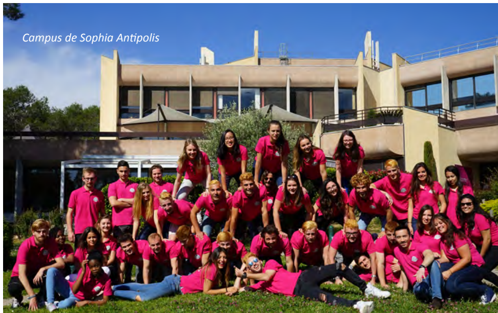
Campus de Sophia Antipolis