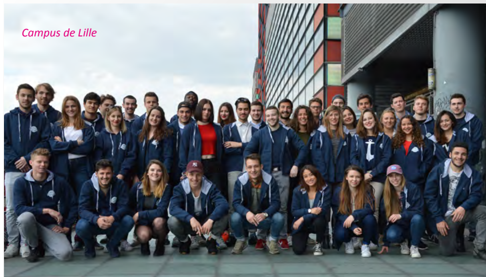
Campus de Lille